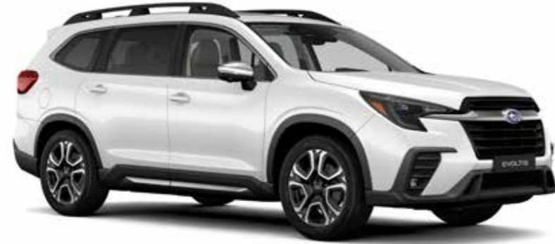
Crystal White Pearl

08 19 מחזיקי כוסות ובקבוקים* 19 מחזיקי כוסות ובקבוקים זמינים בתוך הרכב, לנוחיותם של כל הנוסעים.