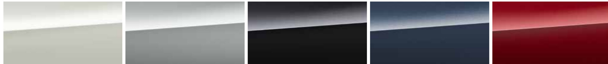
Crystal White Pearl Ice Silver Metallic Crystal Black Silica Cosmic Blue Pearl Crimson Red Pearl