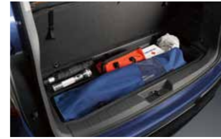
אזור אחסון מתחת לרצפה

הגרסה העדכנית ביותר של מערכת EyeSight*1 מעניקה לנהג ביטחון ושקט נפשי על הכביש. מצלמה רחבת זווית הפועלת בשילוב עם מערך המצלמות הקדמיות לקבלת שדה ראייה רחב יותר, מאפשרת זיהוי מוקדם של הולכי רגל ואופניים בעת כניסה לצומת במהירות נמוכה. הזיהוי המוקדם בעזרת המצלמה ותוספת מגבר הבלם האלקטרוני משפרים את ביצועי הבלימה לפני התנגשות ומגדילים את טווח הפעולה של המערכת.