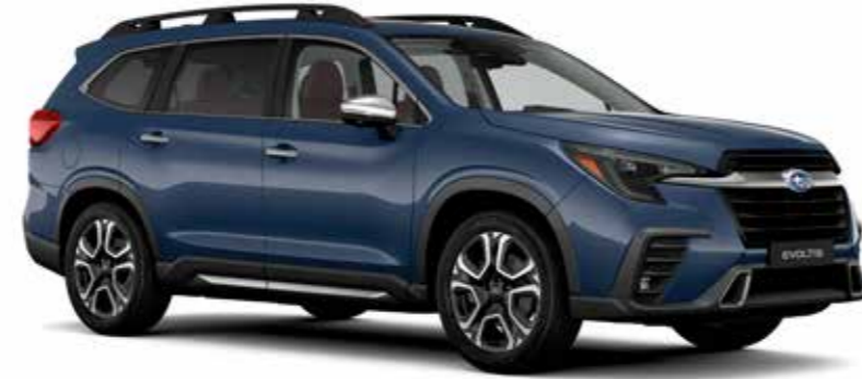
Cosmic Blue Pearl