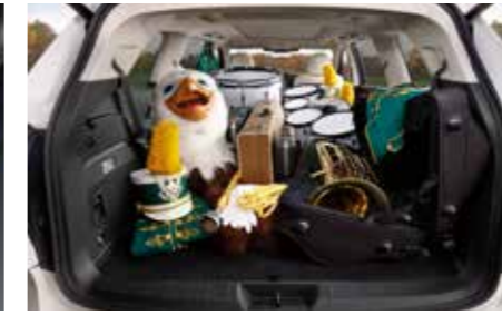
מרחב מטען נדיב